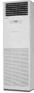
床置型エアコン (3馬力) 室内ユニット 寸法:W600×D350× H1850mm