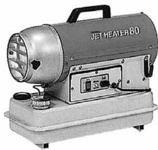
ジェットヒーターミニ HPS80C