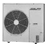
床置型エアコン (3馬力)