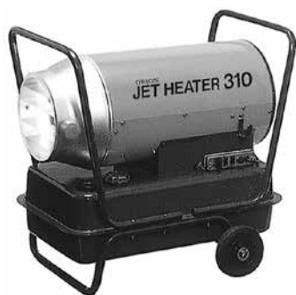
ジェットヒーター HPS310C