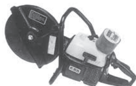
E付ハンドカッター 12"