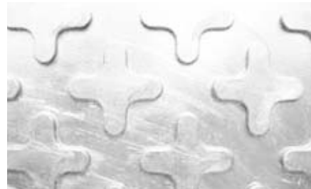
クロス型表面加工(4×8山型/クロス・タイプのみ) 高さが2 ± mmなので歩行者にも適しています。