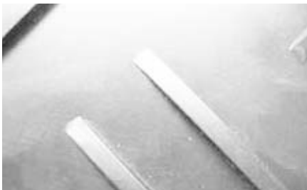
山型表面加工 山型2本線(頂上部分高さ8 ± mm)の特殊デザインから高い滑止め効果を得られます。