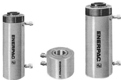
センターホールジャッキ複動