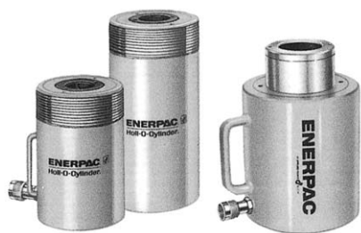
センターホールジャッキ単動