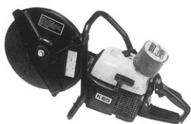
E付ハンドカッター 12"