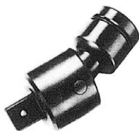
インパクトレンチ用 ユニバーサルジョイント