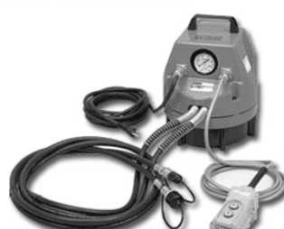
複動分離ストライナー