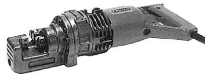
13φハンド鉄筋カッター