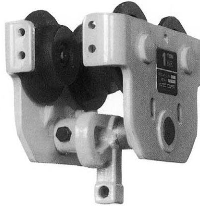
プレートトロリー