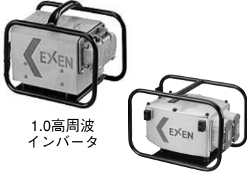
1.0高周波 インバータ