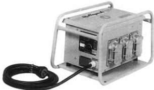
2.4高周波インバータ