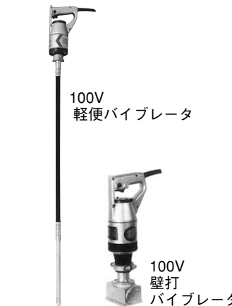
100V 軽便バイブレータ