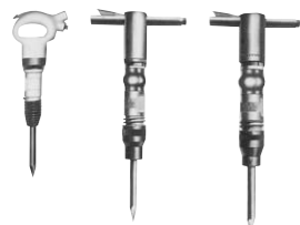
エアーツーパー・ブレイカー