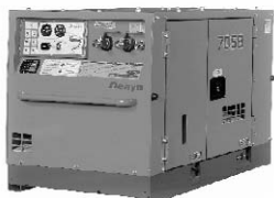
エンジンコンプレッサー （防音タイプ）