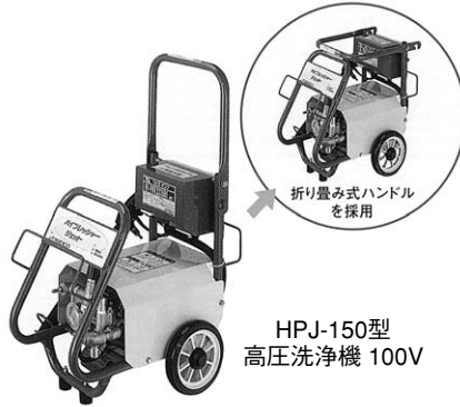
HPJ-150型 高圧洗浄機 100V