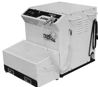
コン太くん I 型