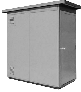
W986×D1886×H2211 (本体寸法) SPB-05型