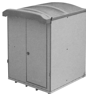
W1485×D1458×H2120 (本体寸法) NB-1515