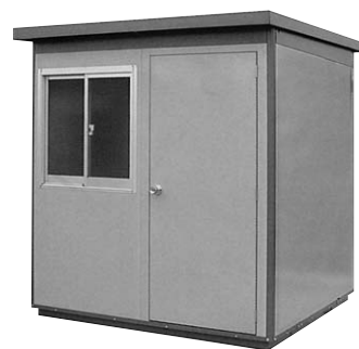
W1886×D1886×H2211 (本体寸法) SPB-10型