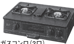
ガスコンロ (2口) 寸法: W560×D422×H193mm 立消安全装置 LPガス