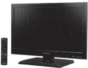
液晶テレビ 20型 W531×D252×H381mm 4.9kg 32型 W761×D273×H535mm 11.4kg ※地上波デジタル放送対応