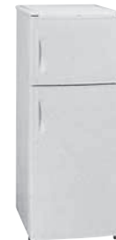
冷凍冷蔵庫 寸法: W545×D585×H1332mm 重量: 40kg 定格内容量: 180ℓ (フリーザー 50ℓ、冷蔵室130ℓ)