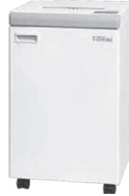
シュレッダー A3 寸法: W500×D500×H850mm 投入幅: 310mm 消費電力: 730W 重量: 76.5kg