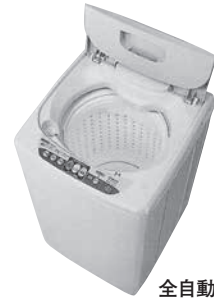
全自動洗濯機 寸法: W539×D508×H935mm 重量: 26kg 洗濯・脱水容量: 4.2kg