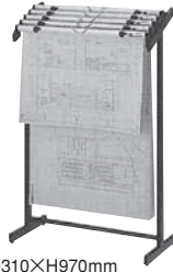
図面掛 寸法: W655×D310×H970mm