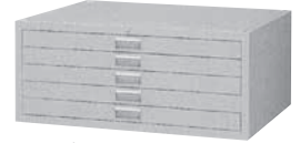
マップケース 寸法: W978×D740×H415mm