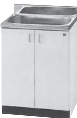
流し台 寸法: W600×D550×H800mm