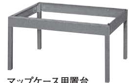
マップケース用置台 寸法: W978×D740×H505mm