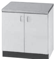
コンロ台 寸法: W600×D540×H620mm