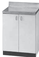
調理台 寸法: W600×D550×H800mm