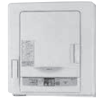
乾燥機 寸法: W630×D436×H670mm 重量: 25kg 乾燥容量: 4.0kg