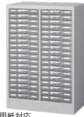
ルーミーケース 寸法: W595×D400×H880mm 2列18段、A4ファイル、B4用紙対応