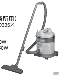
掃除機 (事務所用) 寸法: W371×D336×H443mm 重量: 6.5kg 消費電力: 1050W 吸引仕事率: 350W