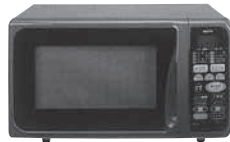
電子レンジ 寸法: W458×D351×H250mm 電子レンジ出力: 500W~50W相当 消費電力: 950W