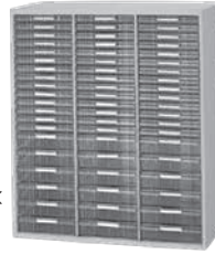
ルーミーケース 寸法: W899×D450×H1050mm 3列20段・B4用