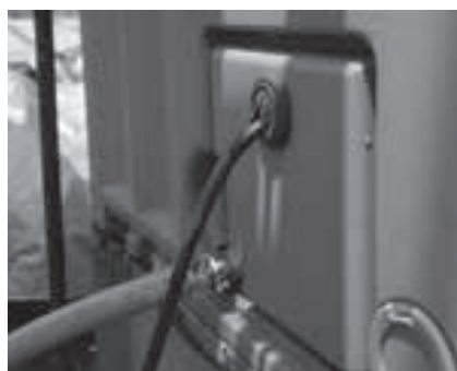
電源と排水ホース