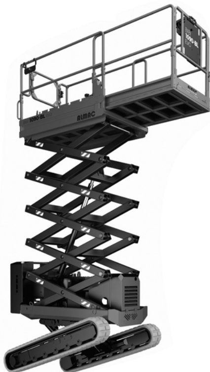
(mm) BIBI 1090 バッテリー