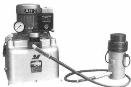
電動油圧シリンダー単動