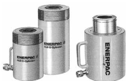
センターホールジャッキ単動