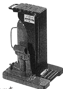
爪付オイルジャッキ