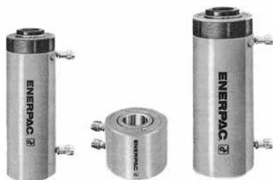
センターホールジャッキ複動