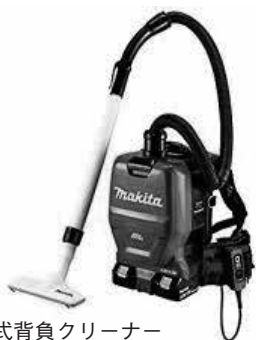
充電式背負クリーナー