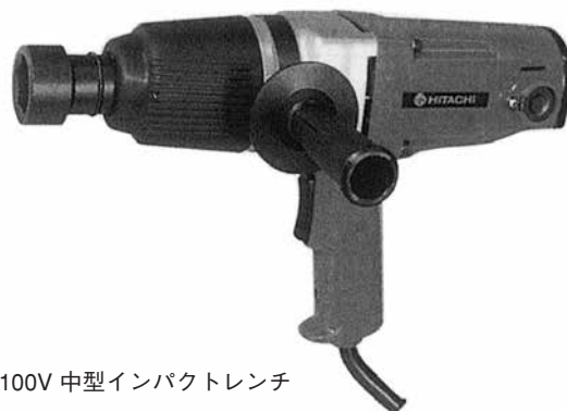
100V 中型インパクトレンチ