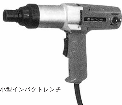
100V 小型インパクトレンチ