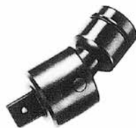
インパクトレンチ用 ユニバーサルジョイント