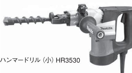
電動ハンマードリル (小) HR3530