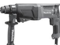
電動ハンマードリル HR2600