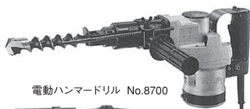
電動ハンマードリル No.8700