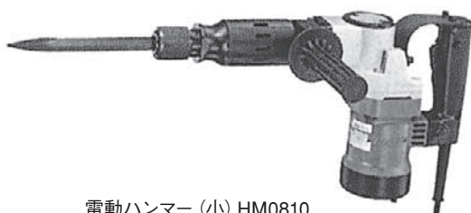
電動ハンマー (小) HM0810