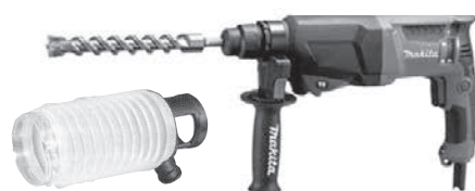
オプションで 集塵カップ取付可