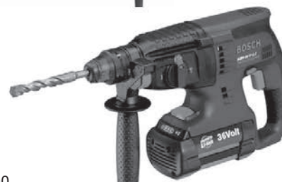
充電ハンマードリル GBH36V-LI