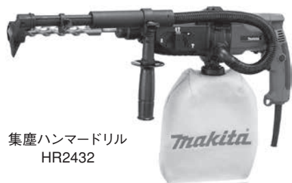
集塵ハンマードリル HR2432