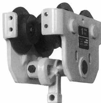
プレートトロリー