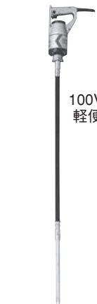
100V 軽便バイブレータ