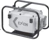
1.5 高周波耐水 インバータ