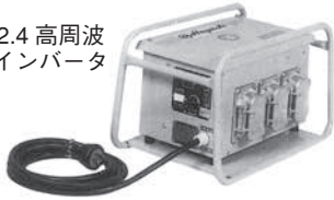
2.4 高周波 インバータ