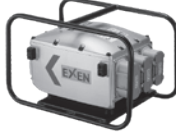
2.0 高周波耐水 インバータ