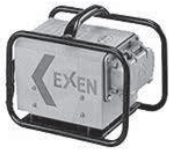
1.0 高周波 インバータ