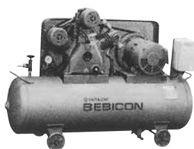
電動コンプレッサー