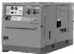
エンジンコンプレッサー (防音タイプ)