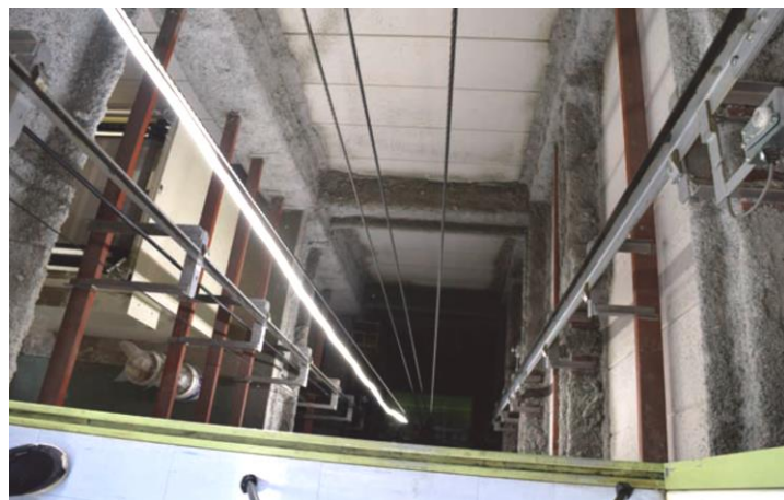
シャフト内の照明