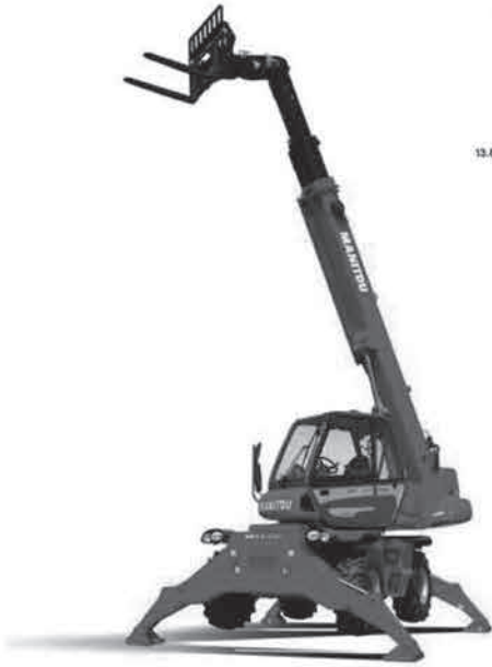
フォークアウトリガー使用時